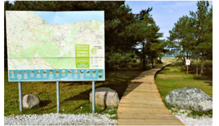
Liimala ranna laudtee.