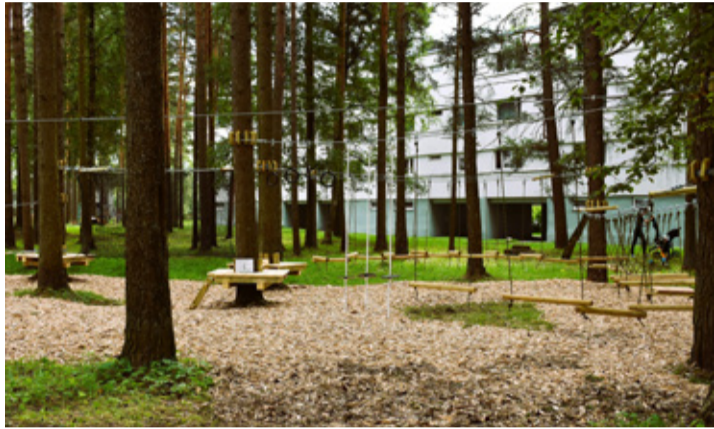
Püssi madalseiklusrada.

Järgmine ajalehe number ilmub 18. detsembril.